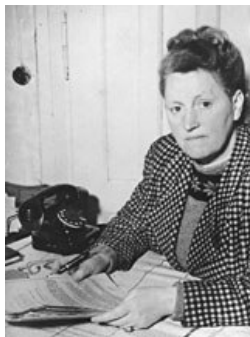
Dr. Elisabeth Selbert 1946 (an ihrem 50. Geburtstag)

Das Online-Findbuch ist zu finden unter: http://www.uni-kassel.de/frau-bib/recherche.htm