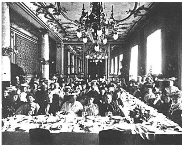
Internationaler Frauenkongress 1904 in Berlin.

http://de.wikipedia.org/wiki/Recht_am_eigenen_Bild