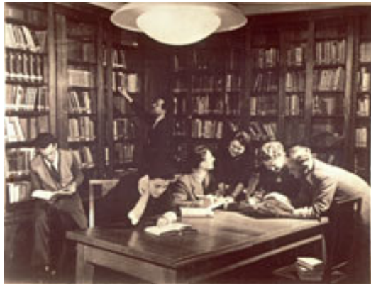
Seminar für Soziale Arbeit, Bibliothek, Copyright: Alice-Salomon-Archiv, Berlin

Siehe unter Kapitel Eigenes Archiv/Räumliche Voraussetzungen Seite 22