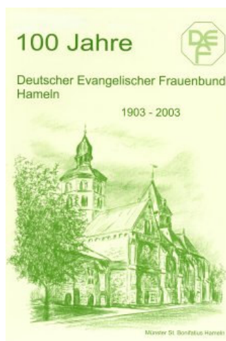
Abbildung: Festschrift 100 Jahre Deutscher Evangelischer Frauenbund Hameln 1903 - 2003

Mit etwas Glück reichen die so erlangten Mittel nicht nur für eine angemessene Festschrift, sondern können z. T. auch genutzt werden, um Ordnung und System in die Unterlagen zu bringen.